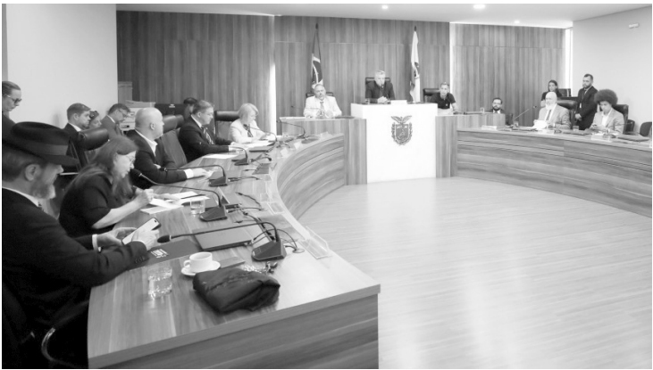
> Ao todo, cinco testemunhas escolhidas pelo parlamentar prestaram depoimento