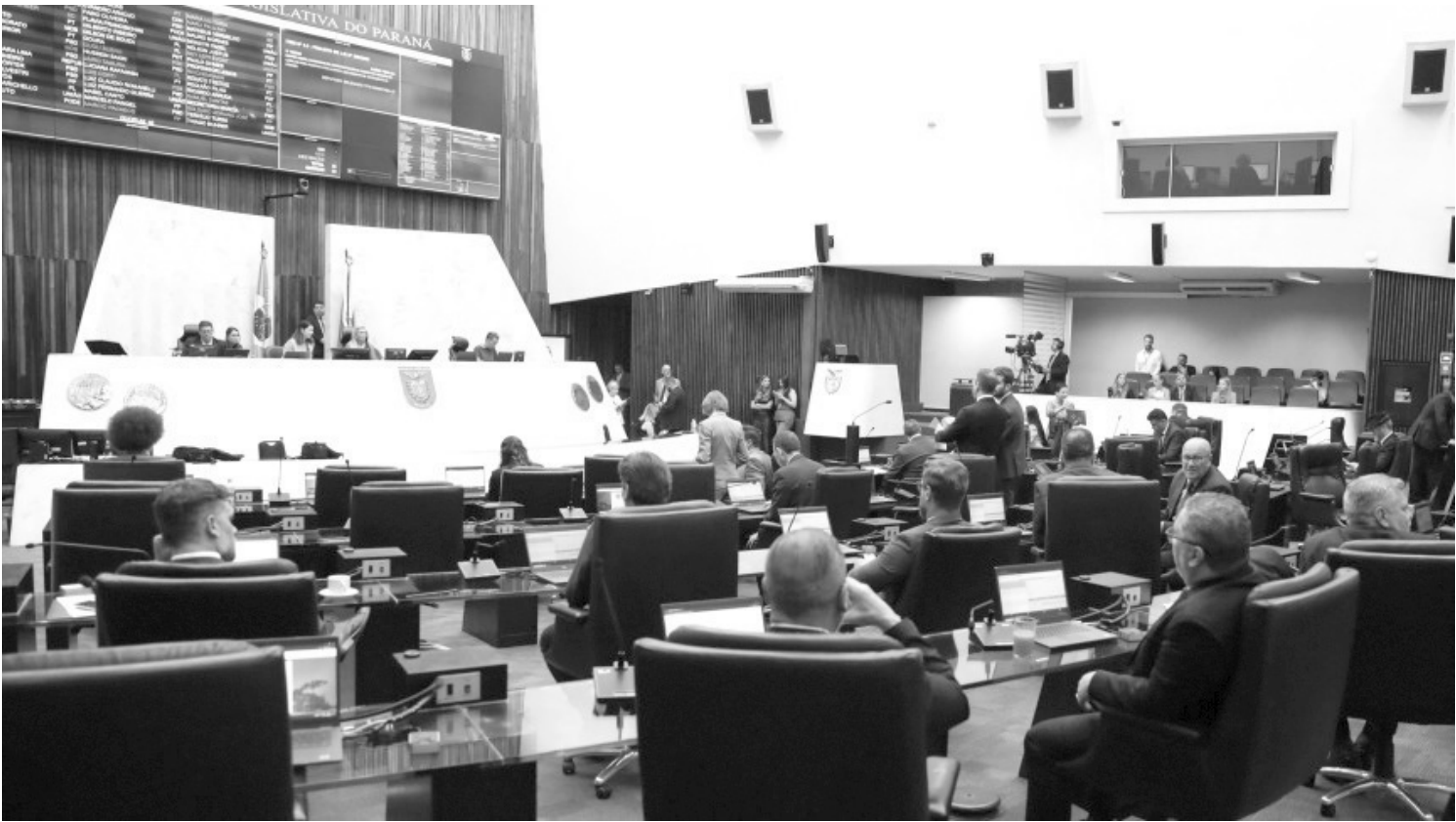
> Proposição foi um dos itens apreciados pelos parlamentares na sessão plenária desta segunda-feira (9)

Entre os objetivos previstos no texto estão sensibilizar a população para a importância da doação; orientar sobre os locais de entrega das mechas e promover ações que fortaleçam a empatia; e o apoio aos pacientes. A expectativa é ampliar a rede de voluntários e instituições que atuam na área, garantindo que mais perucas cheguem às pessoas que delas necessitam durante o tratamento.