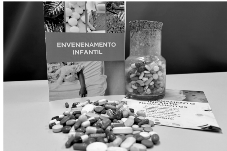
> O objetivo é alertar sobre os riscos de intoxicações e os cuidados essenciais para proteger as crianças

cance das crianças. Embora menos frequentes, escolas e creches também exigem atenção redobrada para evitar que as crianças tenham