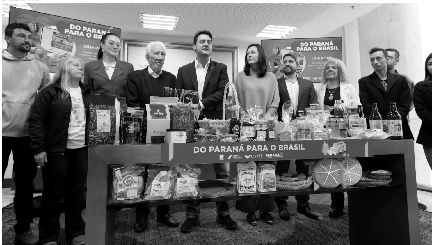
> São 23 vendedores expondo no microsite da Shopee