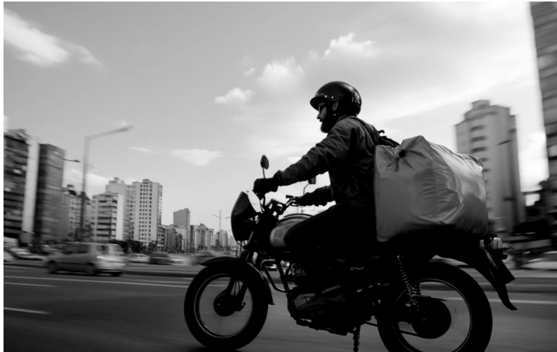
> Associação critica decisão judicial que favorece iFood, alegando prejuízos aos bares e restaurantes que ainda enfrentam os impactos da pandemia

A Abrasel (Associação Brasileira de Bares e Restaurantes) expressa sua profunda indignação com a recente decisão judicial que permite ao iFood manter os benefícios do Programa Emergencial de Retomada do Setor de Eventos (Perse). O Perse, aprovado pelo Congresso em 2021, foi criado com o objetivo de apoiar na recuperação de setores duramente atingidos pela pandemia, como o de eventos e alimentação fora do lar, fornecendo um alívio econômico essencial para ajudar esses negócios a se reerguerem.