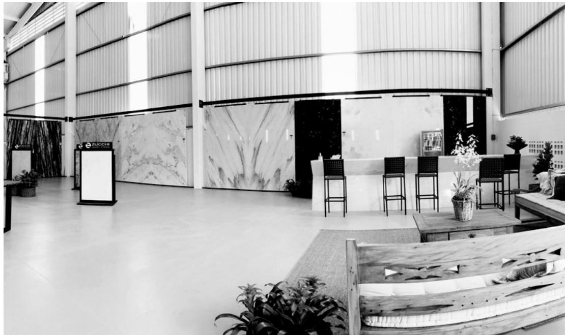
> Brazilian Stone Tour abre fronteiras e apresentará pedras brasileiras para especificadores nos principais centros de distribuição dos EUA