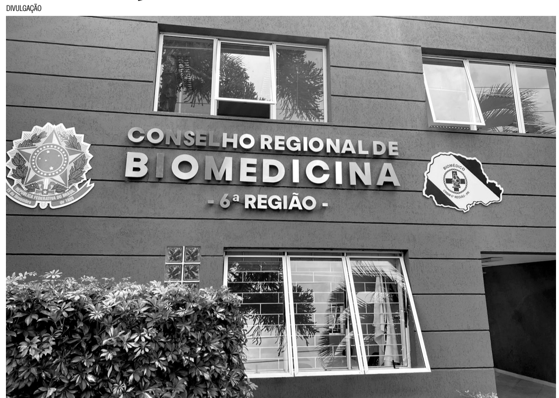
Divulgação. > Ao realizar as fiscalizações, o Conselho atesta que o profissional e as empresas agem dentro da lei e cumprem as normas legais estipuladas

O Conselho Regional de Biomedicina do Paraná 6ª Região (CRBM6) realizou 1.092 ações de fiscalizações em 2024, em 133 municípios de diferentes regiões do Estado. Ao todo, 802 estabelecimentos comerciais foram inspecionados e 443 autos de infração foram aplicados. Ao longo do mesmo período a entidade recebeu 218 denúncias.