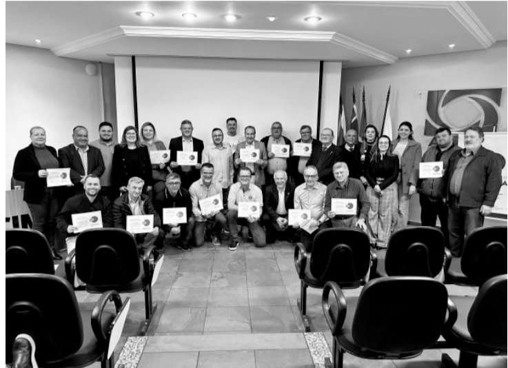
> Empresários, voluntários e clubes de serviços foram reconhecidos por seus grandes feitos em prol ao hospital