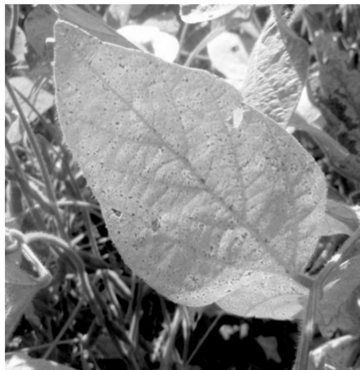
> Os princípios fundamentais do vazio sanitário e calendário de semeadura da soja foram mantidos

PEDIDO DE RENOVAÇÃO DE LICENÇA DE OPERAÇÃO BONALDO & BONALDO LTDA, torna público que requereu ao IAT, Pedido de Renovação de Licença de Operação para FABRICAÇÃO DE CABINES, CARROCERIAS E REBOQUES PARA OUTROS VEÍCULOS AUTOMOTORES, EXCETO CAMINHÕES E ÔNIBUS implantada na RUA HENRIQUE BOMBARDELLI, nº 133 - JARDIM CONCÓRDIA - TOLEDO/PR.