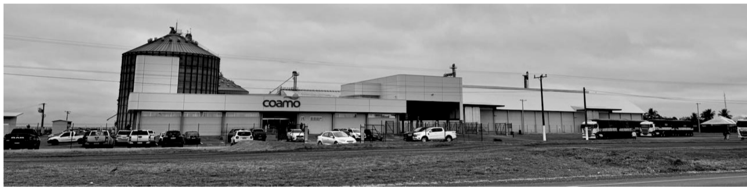
> Investimento é realizado dois anos após a chegada da cooperativa na região, uma das mais produtoras do Estado