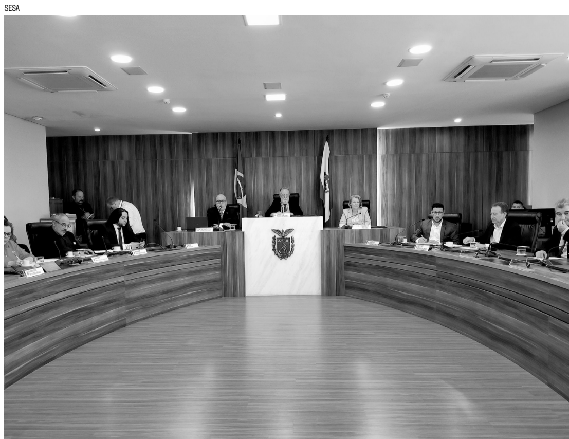
> As metas são em linhas de cuidados de todos os níveis

Em relação à saúde da mulher, o cuidado pré-natal mostra evolução. Atualmente, 87,3% das gestantes paranaenses realizam sete ou mais consultas de pré-natal. Dentro desse escopo, a meta estipulada era de 86%. Já na linha de cuidado à pessoa com deficiência, que determina que ao menos 90% dos nascidos vivos recebam quatro testes de triagem neonatal, o Esta-