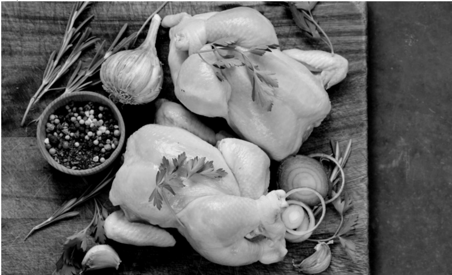
> O Brasil exporta carne de frango para 172 países, é o maior exportador e terceiro maior produtor