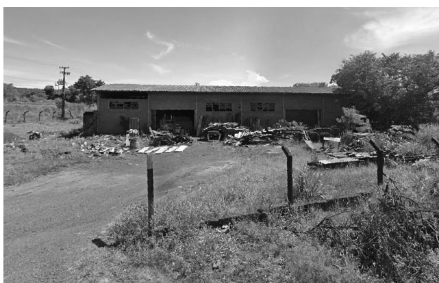
(Imagem do imóvel avaliando - ilustrativa).