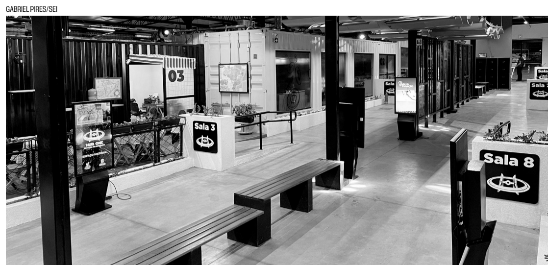
> O local é destinado para o desenvolvimento do empreendedorismo da região e novas tecnologias