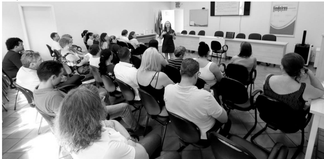
> O evento reuniu os artesãos da região para contribuir com o crescimento e desenvolvimento do setor artesanal

Representantes da Rede de Co-operação para o Artesanato se reuniram para definir algumas questões de incentivo ao setor na região. O encontro ocorreu no Conselho de Desenvolvimento dos Municípios Lindeiros ao Lago de Itaipu, em Santa Helena. O evento reuniu os artesãos da região para contribuir com o crescimento e desenvolvimento do setor artesanal.