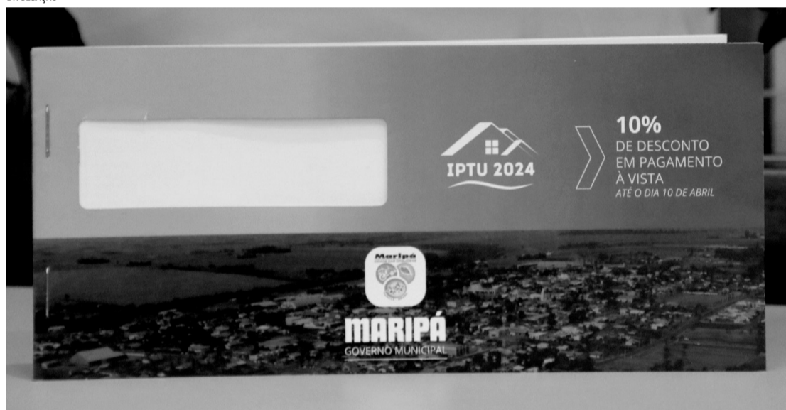
> O imposto pode ser pago em parcela única ou em até sete vezes