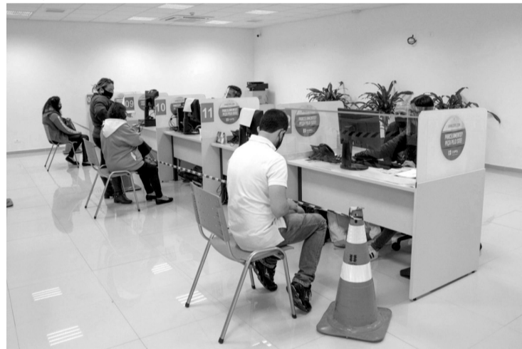
> A empresa oferece isenção de juros e multas e sem correção monetária sobre o valor original

Cientes que possuem débitos com a Copel vencidos há mais de um ano agora têm condições diferenciadas para regularizar a situação. A empresa oferece isenção de juros e multas e sem correção monetária sobre o valor original para residências e propriedades rurais. Isso resulta em uma redução de até 50% no valor final em débito com a concessionária, que pode ser pago à vista ou em até 96 parcelas, de acordo com a avaliação de cada caso.