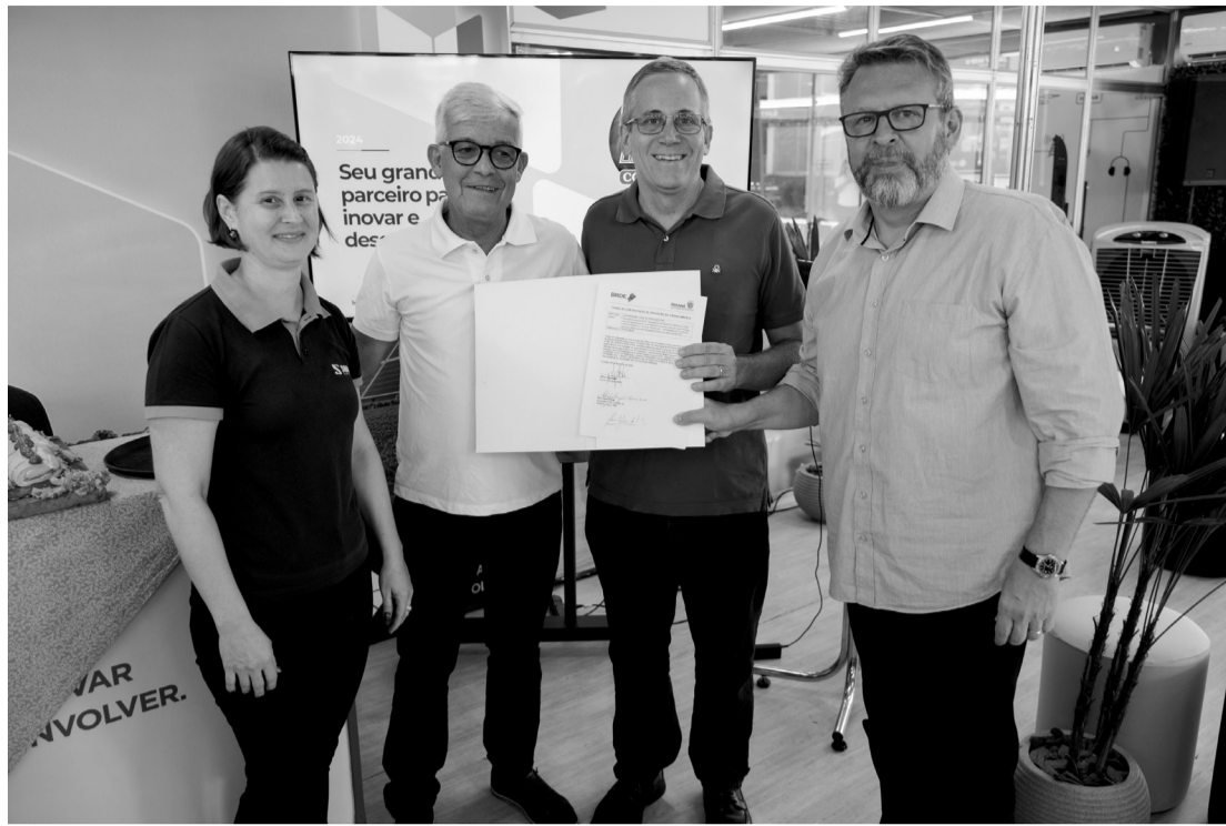
> Cinco empresas e uma cooperativa apresentaram projetos alinhados com a diretriz da Finep