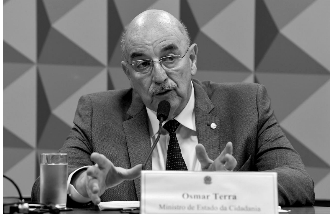
> O deputado federal Osmar Terra foi o autor da proposta

Atualmente, o condenado por crime considerado hediondo, além das penas previstas, não pode receber benefícios de anistia, graça e indulto ou fiança. Além disso, deve cumprir a pena inicialmente em regime fechado.