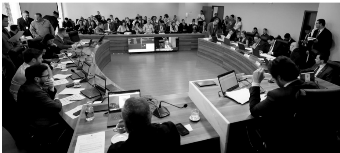
> Uma proposta dispõe sobre as carreiras nas Universidades Estaduais; outra institui bônus para servidores da Secretaria de Educação

A Comissão de Constituição e Justiça (CCJ) da Assembleia Legislativa do Paraná aprovou duas propostas que promovem alterações no ensino superior e na educação básica do Estado. O projeto de lei 1021/2023 altera as Carreiras do Pessoal Docente e Técnico-Administrativo das Instituições de Ensino Superior do Estado do Paraná. Já o projeto de lei 1005/2023 institui o Bônus de Resultado de Aprendizagem (BRA) aos servidores efetivos da Secretaria de Estado da Educação (SEED). As duas matérias são de autoria do Poder Executivo.