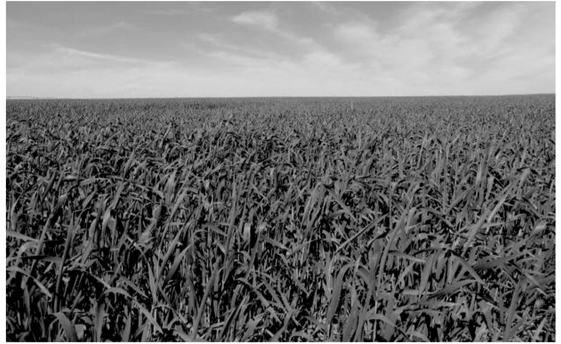
Resultado equivale a 10,6% do território nacional

No período de 1985 a 2022, a área reservada à agropecuária no Brasil cresceu 50%, ocupando 95,1 milhões de hectares (ha). A área equivale a 10,6% do território nacional e é maior que a do estado de Mato Grosso, por exemplo. A análise é da rede colaborativa de Mapeamento Anual do Uso e Cobertura da Terra no Brasil (MapBiomias) e foi divulgada na sexta-feira (6).